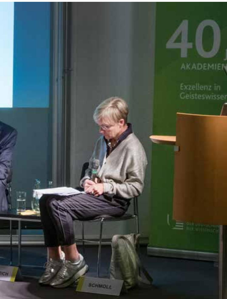
Diskussionsveranstaltung „Bewährt, lebendig, vernetzt – 40 Jahre Langzeitforschung im Akademienprogramm“, Hamburg 2019

ist es, gemeinsame Betätigungsfelder zu erkennen und Erkenntnisse aus der Forschung für ökonomisches Handeln fruchtbar zu machen – zum Beispiel mit Podiumsdiskussionen zu Künstlicher Intelligenz, Energieeffizienz oder Hirnforschung.