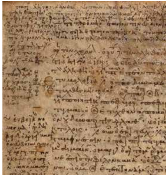
Die Quelle: „Etymologicum Gudianum“

„Eine Gruppe von Gelehrten im späten 10. Jahrhundert arbeitete gemeinsam an diesem Text und Manuskript, um es mit Material aus anderen Quellen zu erweitern und ein neues etymologisches Lexikon zur Erklärung und Vergegenwärtigung der griechischen Sprache zu erstellen.“